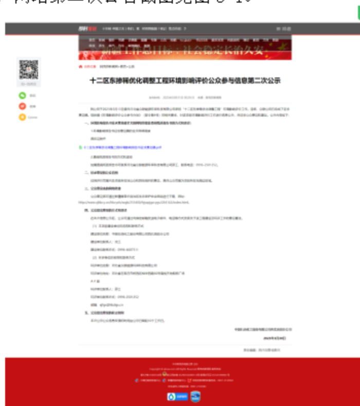
图 3-1 第二次信息公示情况

我公司在阿克苏新闻网网站 ( http://www.aksxw.com/sy/gg/202303/t20230331_12539357.html ) 上发布了征求意见稿公示信息，对环境影响报告书征求意见稿全文进行公开，公示时限为 10 个工作日，网站第二次公告截图见图 3-1。