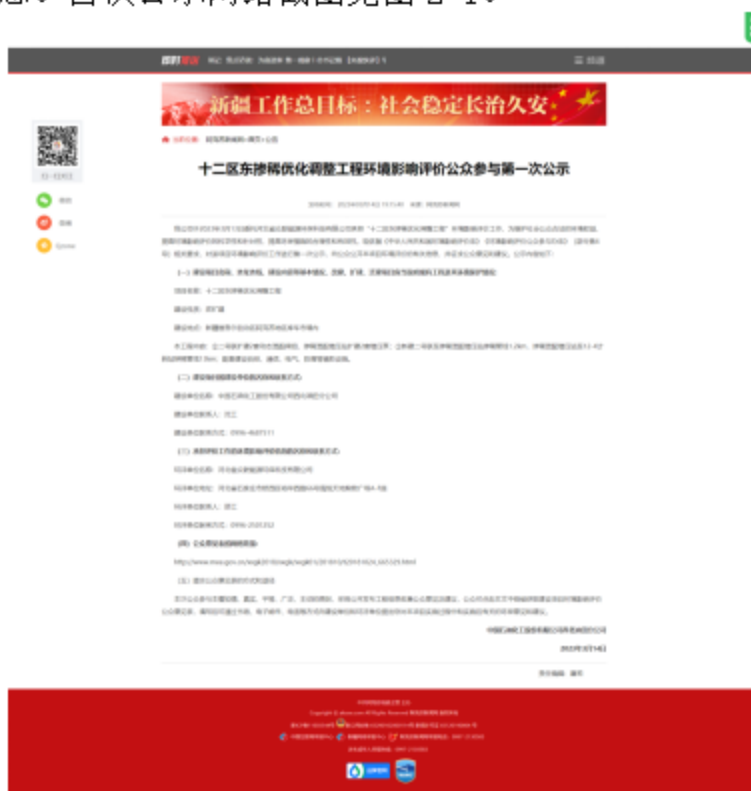
图 2-1 第一次信息公示情况

2023 年 3 月 14 日，我公司在阿克苏新闻网网站 ( http://www.aksxw.com/sy/gg/202303/t20230314_12220338.html ) 上发布了第一次公示信息。首次公示网络截图见图 2-1。