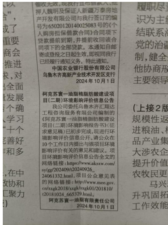
本项目第一次报纸公示截图