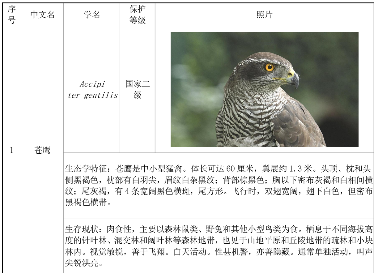
表 4.2-21 评价区域重点野生保护动物