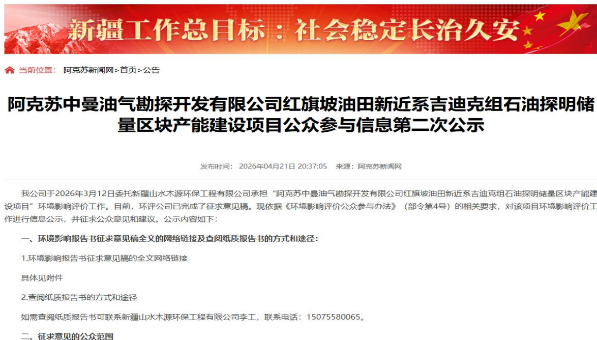
图 3-1 第二次信息公示情况

我公司在阿克苏新闻网网站上发布了征求意见稿公示信息，对环境影响报告书征求意见稿全文进行公开，公示时限为10个工作日，网站第二次公告截图见图3-1。