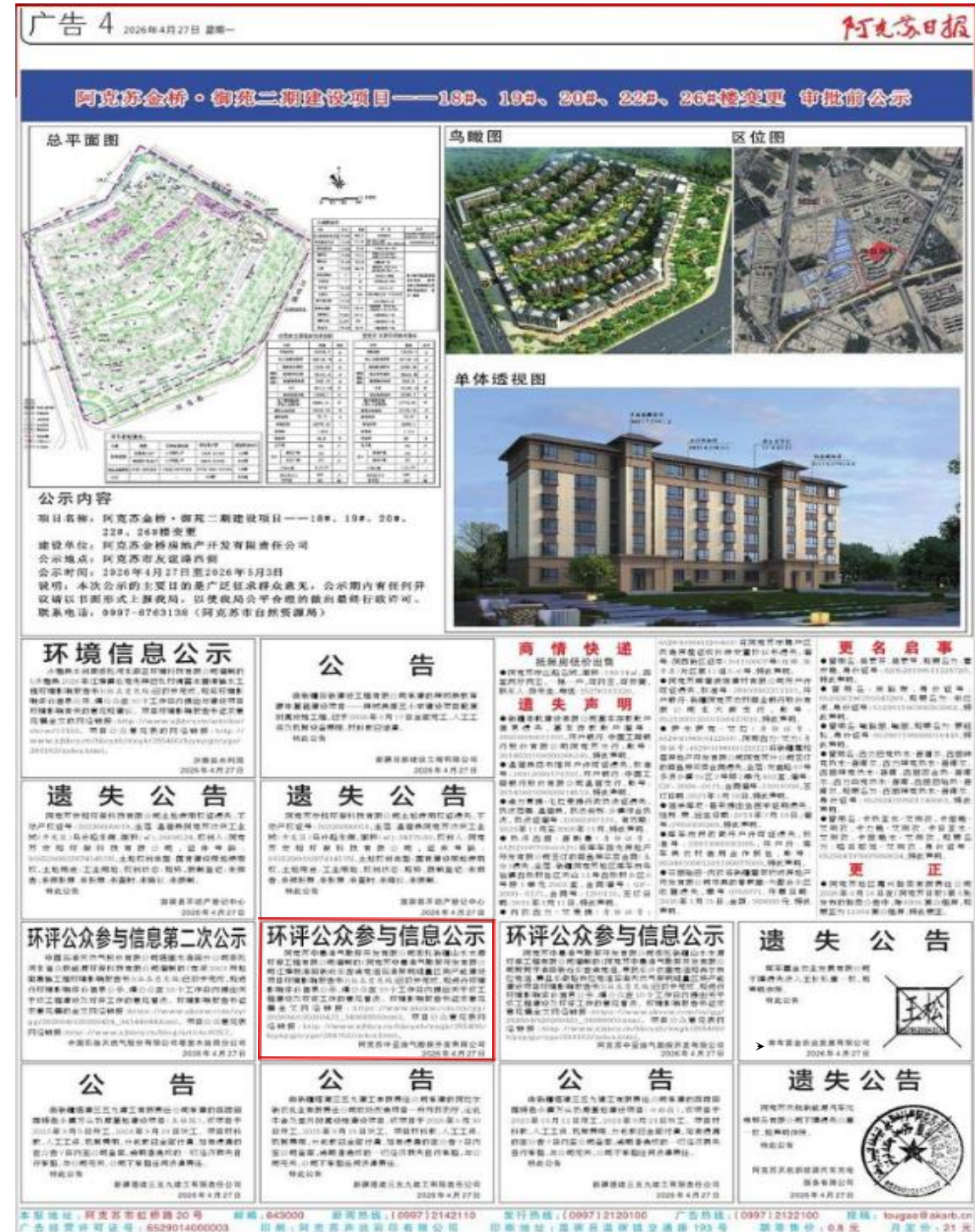
3-2 2026年4月27日《阿克苏日报》公示情况

在网络公示的同时，我公司于2026年4月27日、2026年4月28日在《阿克苏日报》上发布了项目环境影响报告书公示信息，报纸公示照片见图3-2至图3-3。