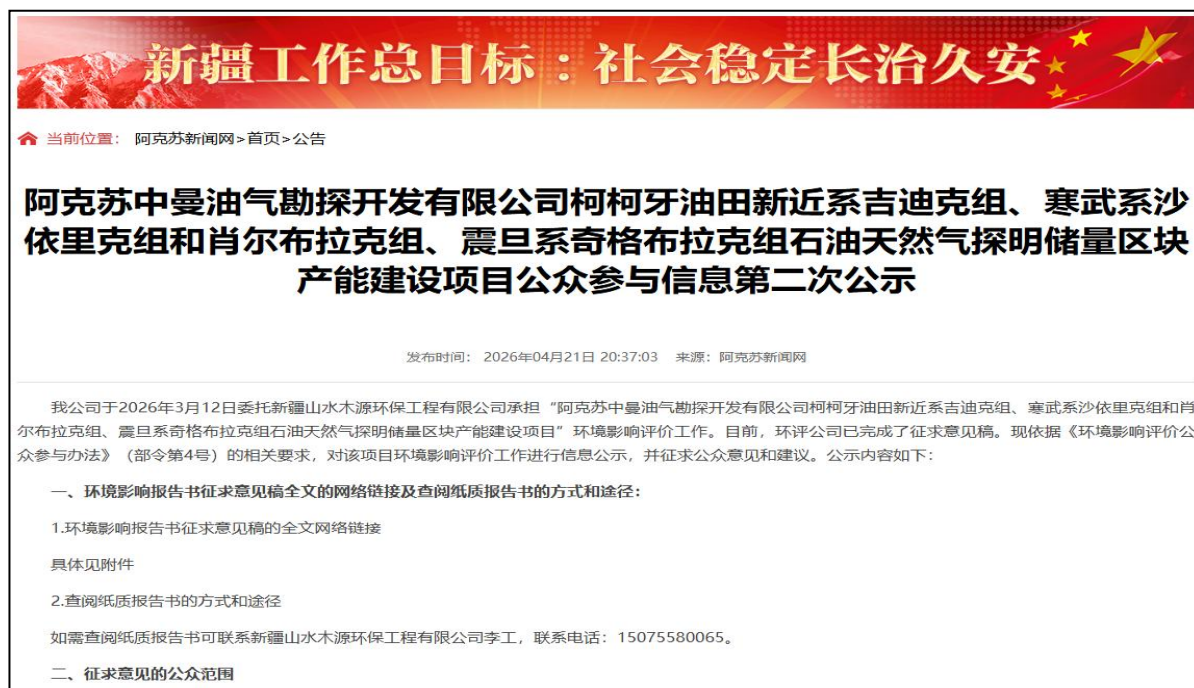
图 3-1 第二次信息公示情况

我公司在阿克苏新闻网网站上发布了征求意见稿公示信息,对环境影响报告书征求意见稿全文进行公开,公示时限为10个工作日,网站第二次公告截图见图3-1。