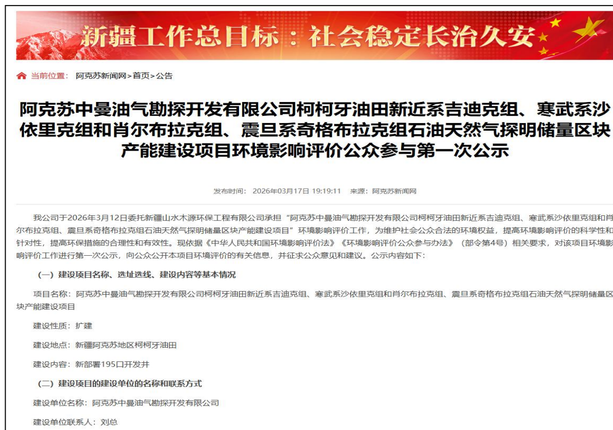
图 2-1 第一次信息公示情况

2026 年 3 月 17 日，我公司在阿克苏新闻网网站上发布了第一次公示信息。首次公示网络截图见图 2-1。